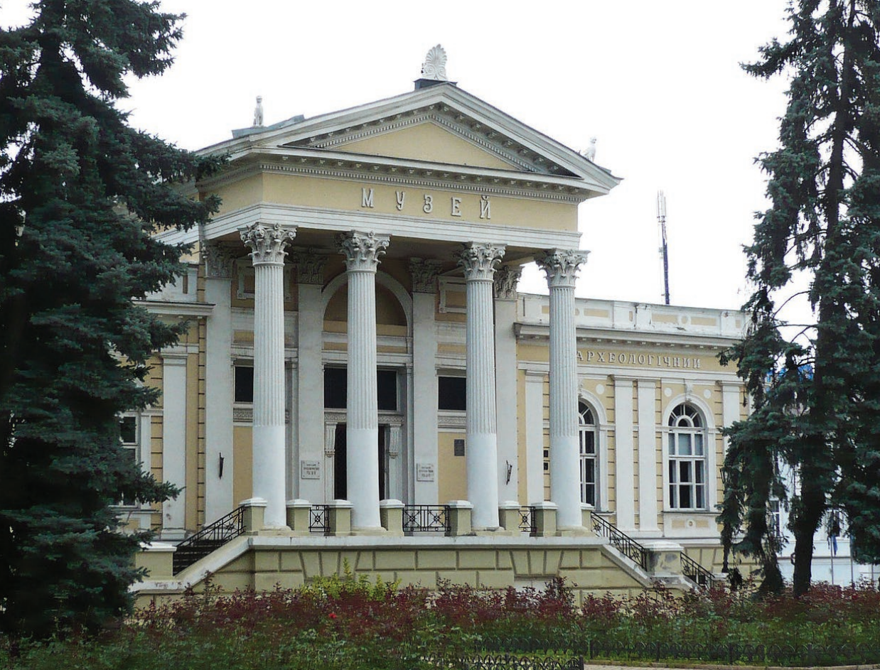
Muzeum Archeologiczne w Odessie, 1883, architekt Feliks Gąsiorowski, fot. Tomasz Leśniowski