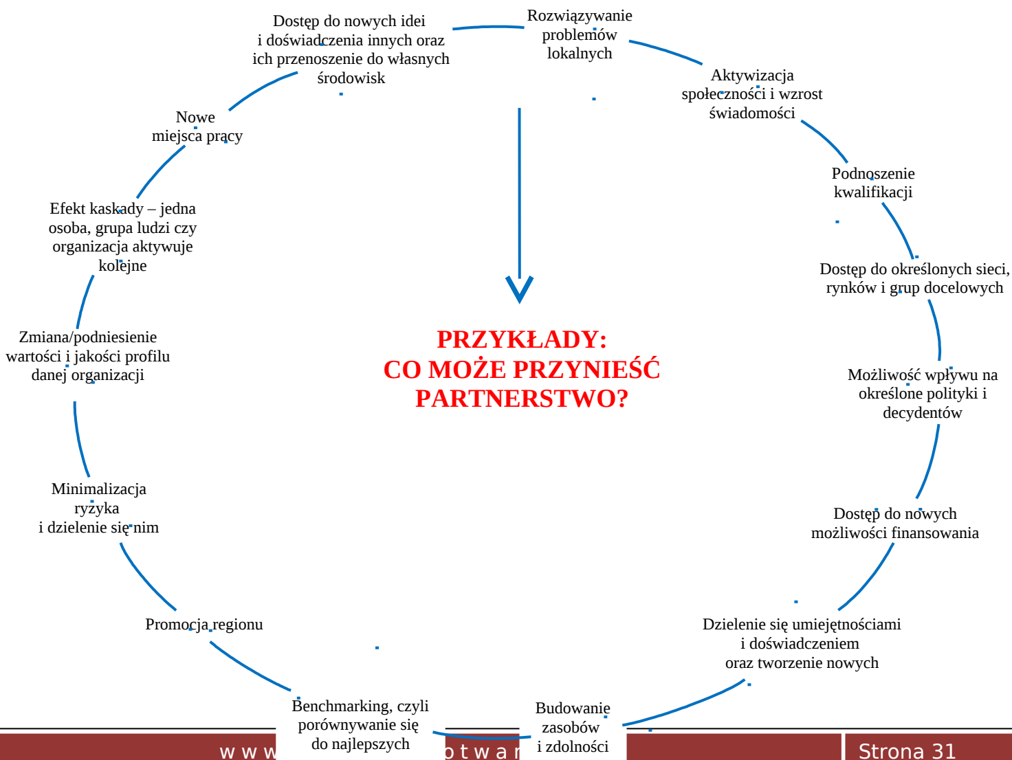
Schemat 1. Korzyści z partnerstwa międzysektorowego

Poniższy schemat przedstawia korzyści wynikające z partnerstwa międzysektorowego.