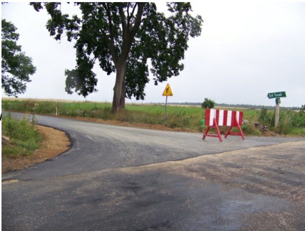
Droga w Turku

remontacyjną. W 2007 roku porożono namierzoną asfaltową na drogach w miejscowościach Zdrody Nowe, Brzozowo Panki, Kamińskie Pliszki, Gabrysin. W 2008 roku zostały zmodernizowane następne odcinki dróg: we wsi Józefin i Pietkowo – Turek.