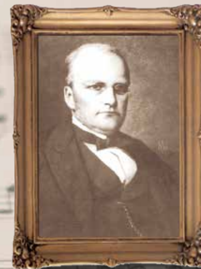
Stanisław Moniuszko 5 maja 1819 – 4 czerwca 1872

Białostocki Ośrodek Kultury, ul. Legionowa 5