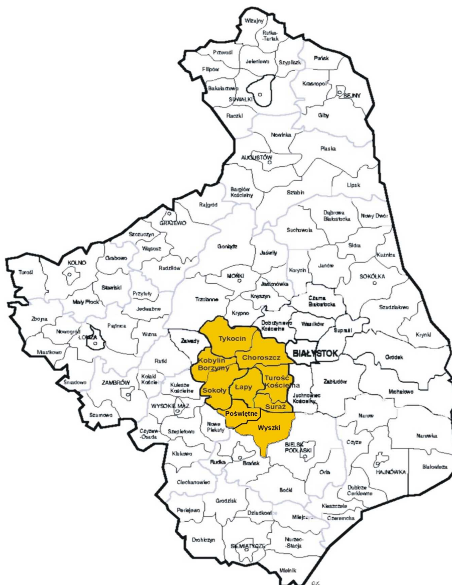
Rysunek 1. Granice administracyjne LGD N.A.R.E.W.