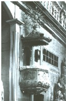
Kościół p.w. NMP i św. S. Biskupa w Narwi

Ambona-kazalnica to jeden z ważniejszych elementów wyposażenia kościoła chrześcijańskiego, w kościołach obrządku wschodniego występuje rzadko, w ewangelickich spotykamy często ambony-ołtarze. Odpowiednikiem ambon w synagogach jest bima, a w meczetach minbar. Służy ona do odczytywania Ewangelii i Epistoły, śpiewania tekstów liturgicznych a od średniowiecza do wygłaszania kazań.