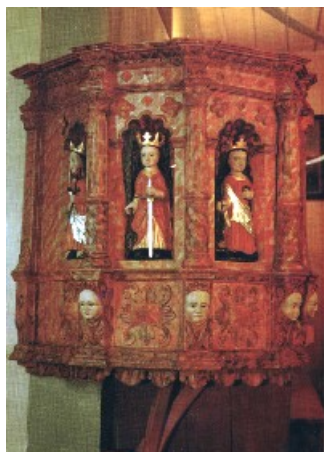
Miłkowice Maćki kościół p.w. Św. Rocha

Kościół parafialny w Rudce - drewniana ambona z poł. XVIII w. polichromowana, złożona; mównica wieloboczna z parapetem zakończonym profilowanym gzymsem; zdobiona ornamentem rocaillowym- w najniższym punkcie dwie główki aniołków; na wolutach dwa anioły, po lewej klęczący, po prawej siedzący; w środkowej płycinie płaskorzeźba przedstawiająca scenę ze Starego Testamentu; kopia z siedzącym aniołem z lewej i wazonem z ogniem gorejącym z prawej strony, zwieńczona rzeźbą Dobrego Pasterza ; na podniebiu baldachimu gołębica- symbol Ducha Świętego.