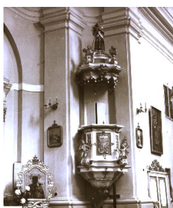
Kościół św. Trójcy w Rudce

Bogactwo materiałów używanych do wykonania i zdobienia jest olbrzymia (kamień, metal, drewno). Kształt, typ i miejsce położenia przeszły również swoistą ewolucję. Od późnego średniowiecza ustaliło się obowiązujące do dziś miejsce ambony-na pierwszym od prezbiterium lub środkowym, lewym filarze nawy głównej. Używany dziś typ kazalnicy zawieszanej na ścianie lub filarze, złożonej z korpusu-mównicy, zaplecka i baldachimu wykształcił się w XVI wieku. Ambony rokokowe o delikatnej, dekoracyjnej ornamentyce; w okresie klasycyzmu były na ogół prostsze w kształcie i dekoracji. XVIII i pierwsza połowa XIX w. przyniosły wyszukane kształty np. kielicha kwiatowego, paszczy ryby, okrętu.