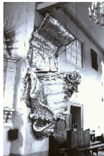
Kościół p.w. Narodzenia NMP w Osrożanach