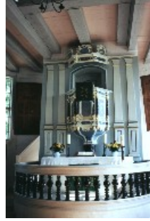
Meklenburgia (Niemcy) ambony - ołtarze

Ambony stają się powoli reliktem przeszłości, w nowopowstających świątyniach brakuje już tego elementu wyposażenia, a kazania głoszone są zza pulpitu tuż przy ołtarzu. Warto więc korzystając z przyjemności krajoznawczych wędrówek zwrócić na nie uwagę.